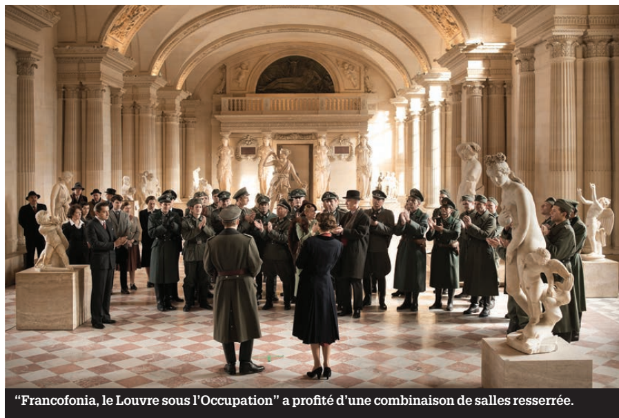
"Francofonia, le Louvre sous l'Occupation" a profité d'une combinaison de salles resserrée.