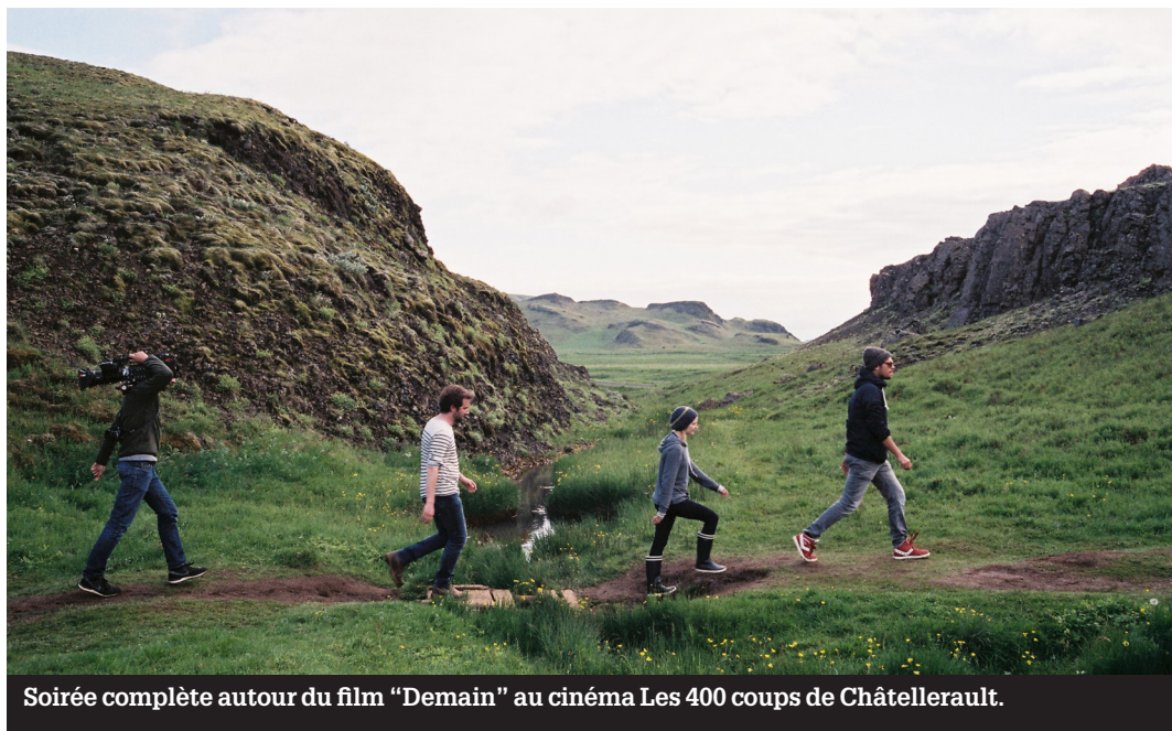
Soirée complète autour du film "Demain" au cinéma Les 400 coups de Châtellerault.