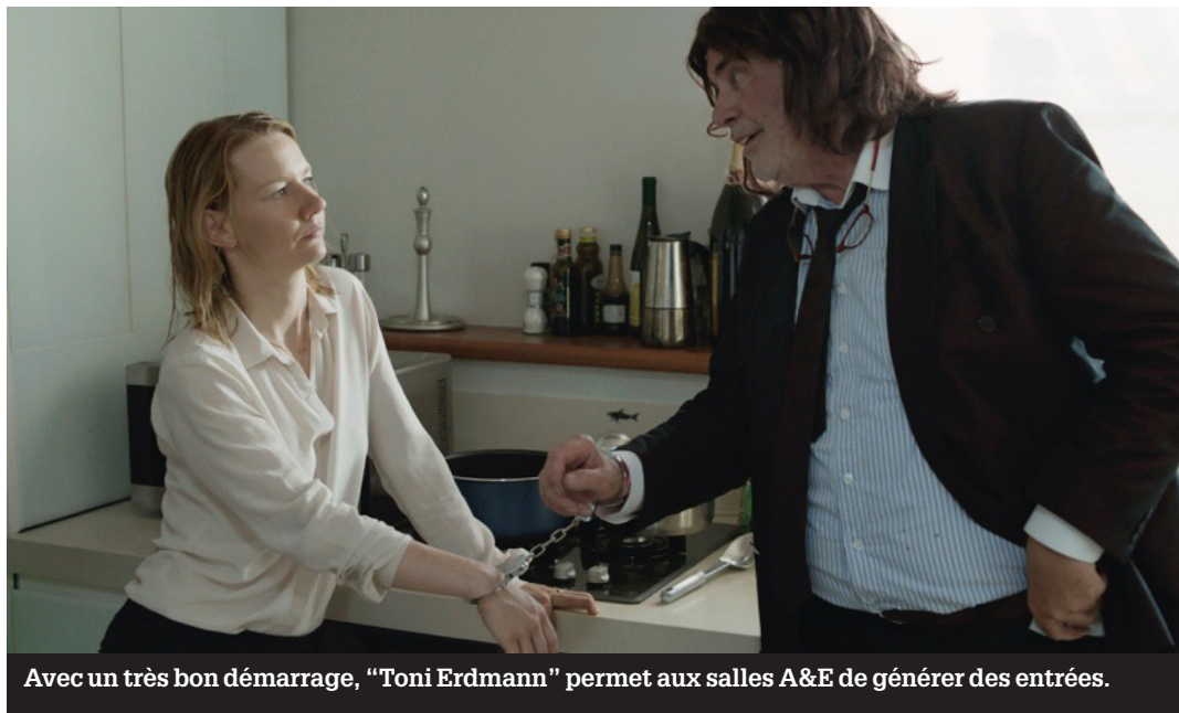
Avec un très bon démarrage, "Toni Erdmann" permet aux salles A&E de générer des entrées.