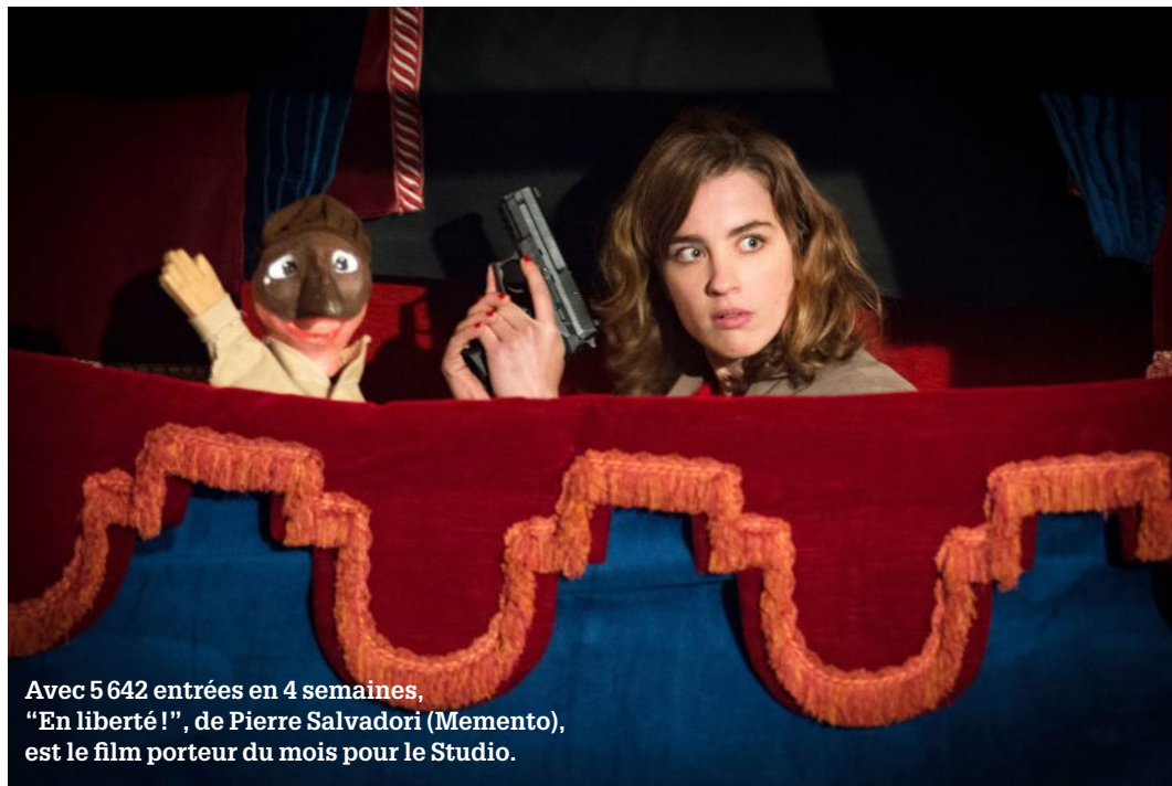
Avec 5 642 entrées en 4 semaines, "En liberté!", de Pierre Salvadori (Memento), est le film porteur du mois pour le Studio.