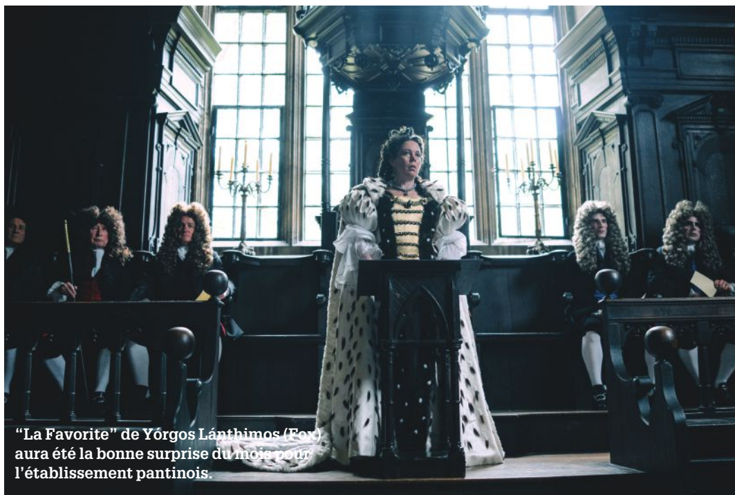
"La Favorite" de Yórgos Lánthimos (Fox) aura été la bonne surprise du mois pour l'établissement pantinois.