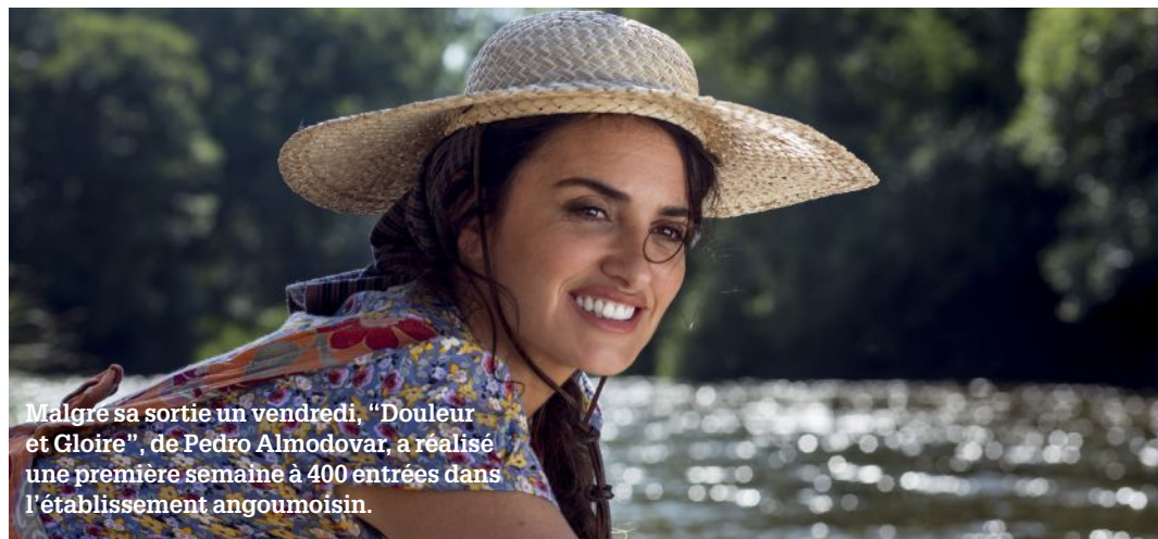
Malgré sa sortie un vendredi, "Douleur et Gloire", de Pedro Almodovar, a réalisé une première semaine à 400 entrées dans l'établissement angoumois.