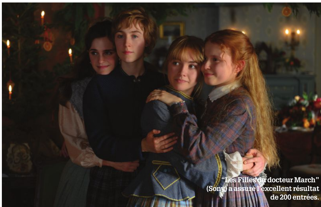
"Les Filles du docteur March" (Sony) a assuré l'excellent résultat de 200 entrées.